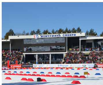
Комплекс «Жемчужина Сибири», г. Тюмень