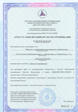
Аттестат аккредитации Органа по сертификации