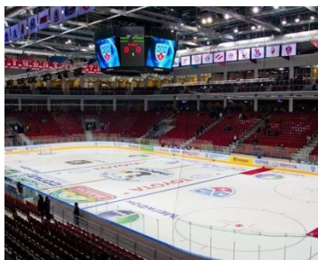
ЛД «Арена-Металлург», г. Магнитогорск