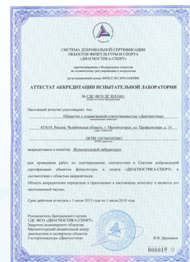
Аттестат аккредитации Испытательной лаборатории