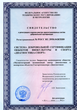
Свидетельство о регистрации системы сертификации