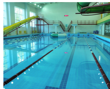
СОК «Металлург», г. Аша