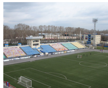
Стадион «Химик», г. Кемерово