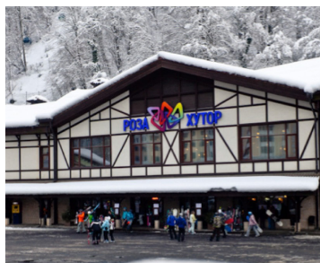
ООО «Роза Хутор», г. Сочи