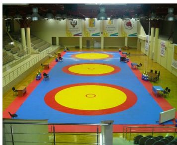
КОГАОУ ДОД ДЮСШ «Богатыри» г. Киров